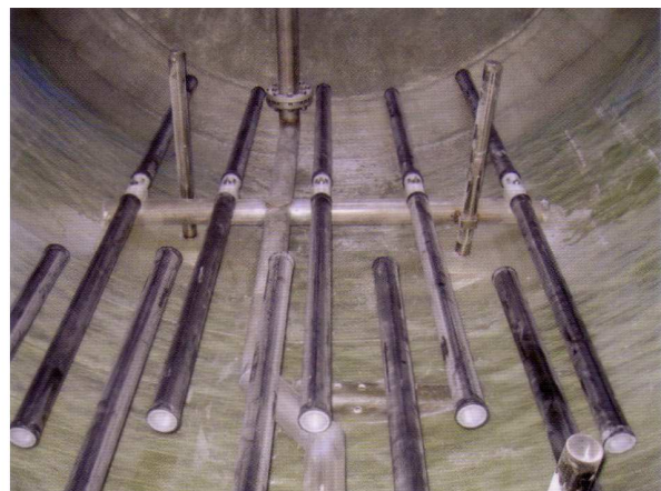
Difusores tubulares de alta eficiencia