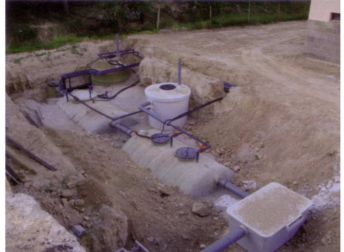
INSTALACIÓN DE UNA DEPURADORA