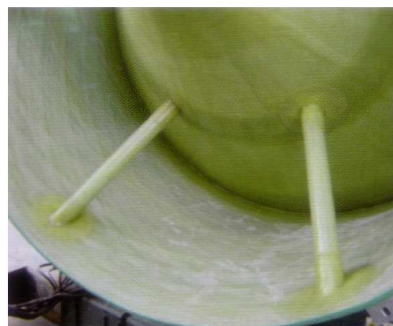
Decantador con faldón