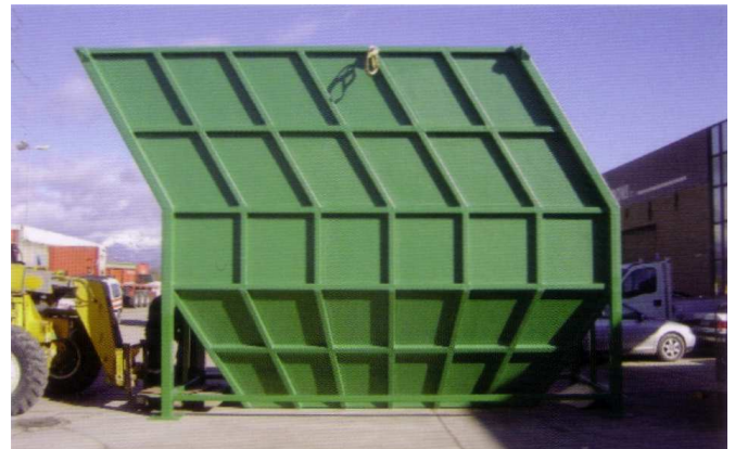
Decantador lamelar con estructura exterior metálica recubierta de fibra.