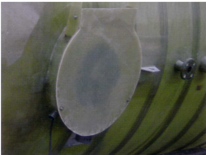
Boca con bisagra DN 700